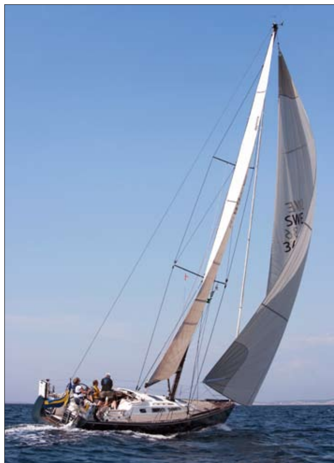
La puissance et l'accélération obtenues lors du déroulement du Gennaker ou du Code 0 sont aussi spectaculaires que faciles à mettre en oeuvre.

Le système est manœuvré par une drosse sans fin qui passe dans une poulie crantée. Un guide drosse étroit introduit la drosse dans le réa cranté et assure le maintien du cordage. Une cale taillée en biseau écarte la drosse lors du déploiement de la voile, permettant à la poulie de tourner librement. Généralement la drosse est guidée tout au long du cheminement vers le cockpit. Pour faciliter la manœuvre de la drosse sans fin, Seldén propose une nouvelle poulie Tandem spéciale. C'est une poulie violon avec deux taquets coinçeurs. Il est également possible d'utiliser une drosse d'enroulement plus courte, manœuvrée par l'équipier d'avant.