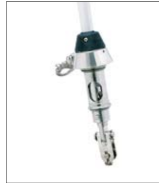
Prêt pour la motorisation.