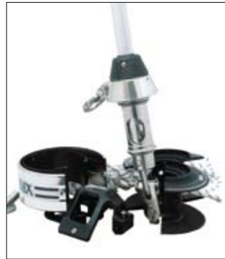
Enlever guide bosse, bosse et demi tambours.