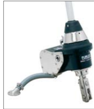
Glisser le Furlex 200E par le bas, installer les câbles. C'est tout !