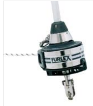
Furlex manuel 200S.

Le confort "presse-bouton" est une amélioration facile pour tous ceux qui ont déjà un Furlex manuel série 200S ou 300S sur leur bateau. La bosse d'enroulement, le tambour et le guide bosse sont simplement remplacés par un moteur électrique Furlex.