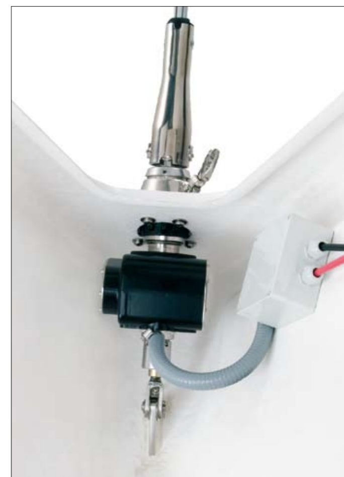
Installation sous le pont d'un Furlex 200E. Le boîtier de connexion est étanche.

Le Furlex Electric est disponible pour des installations sur ou sous le pont. Le principal avantage d'une installation sous le pont est d'avoir de meilleures performances dans la mesure où la longueur du guidant est maximum. Un pont avant dégagé est un bonus supplémentaire !