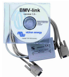
Interface de communication isolée RS232 et logiciel VE.Bat en option (Pour BMV 602 et 602H)